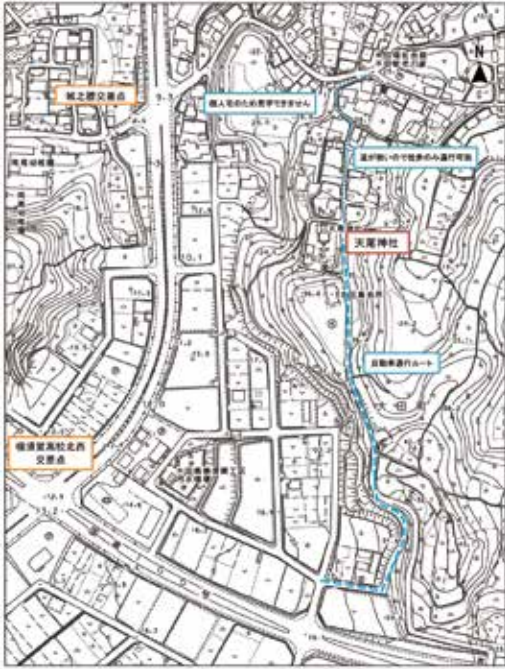
木田城周辺地図(私有地に入ることはいけません)