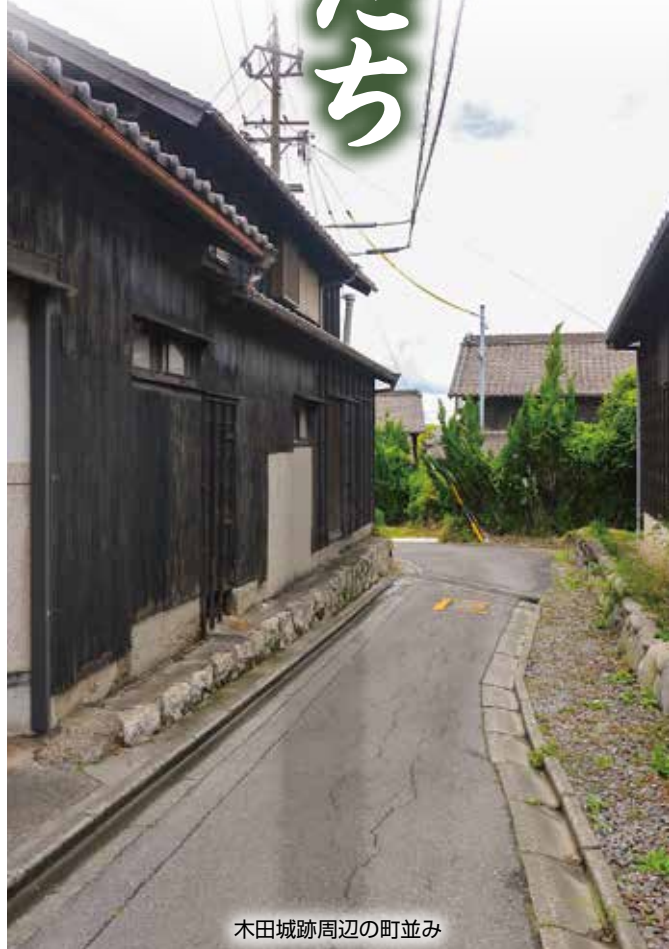
木田城跡周辺の町並み